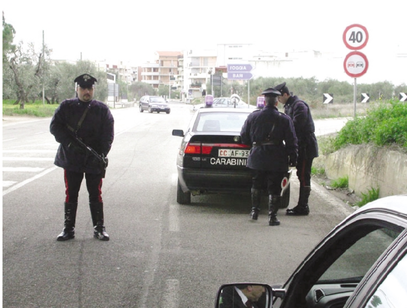
Controlli dei carabinieri, sventato un omicidio passionale