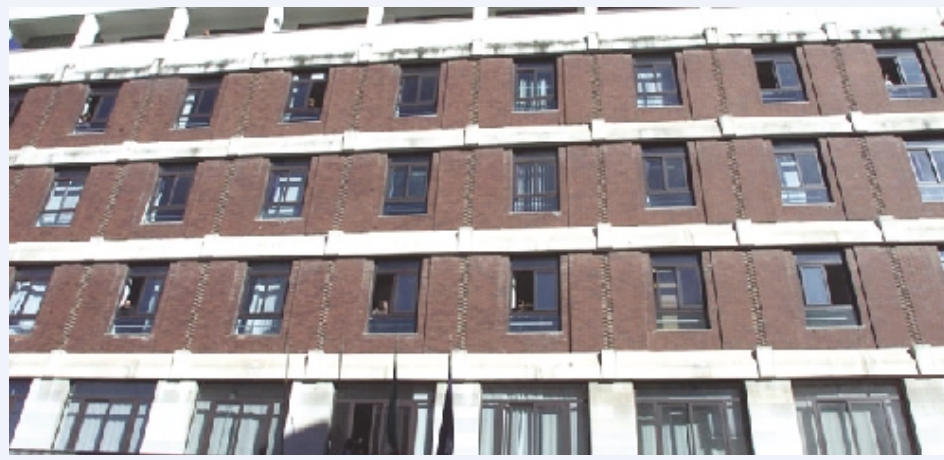
Barletta, Palazzo di Città

Coinvolti sindaco, ex presidente, ex direttore generale, presidente Manutencoop