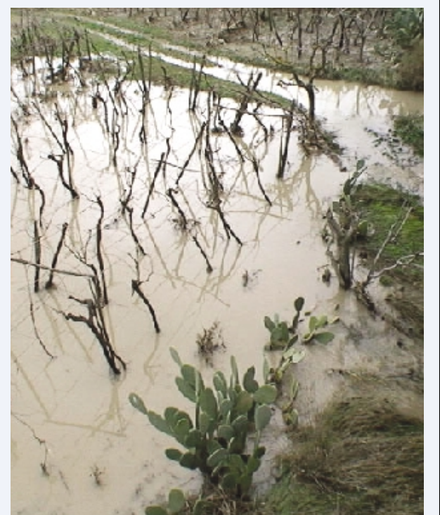
L'Ofanto è ancora in piena