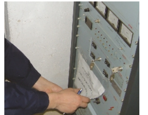
Riacceso il ripetitore di «Radio Company»