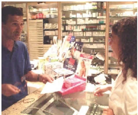
L'interno di una farmacia

Servizio nei centri della Asl 1 Visite specialistiche ora la prenotazione si può fare in farmacia